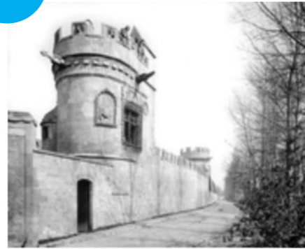
Manoir des Gens d'armes