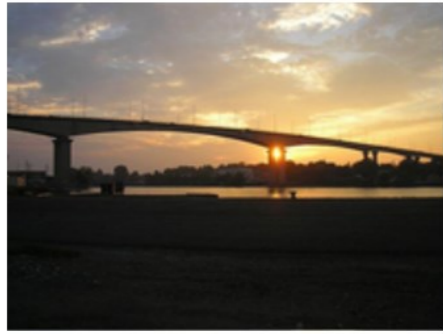
Viaduc de Calix

Le viaduc de Calix est un viaduc routier qui permet le bouclage périphérique Nord de Caen. Il est le deuxième plus long du Calvados après le Pont de Normandie. La moitié Sud du viaduc se trouve sur le territoire de Mondeville et la partie Nord sur le territoire d'Hérouville Saint Clair