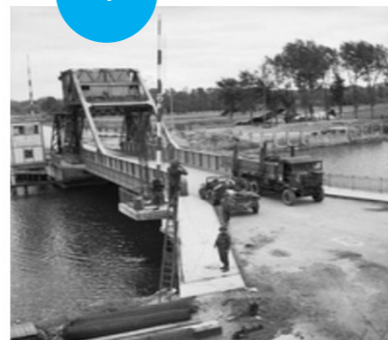
Pegasus Bridge

Pegasus Bridge (pont Pégase) est le nom qu'a reçu, après les opérations du 6 Juin 1944 pendant la Seconde Guerre mondiale, le pont de Bénouville en l'honneur des parachutistes britanniques dont le cheval ailé Pégase était l'emblème. Le pont est inauguré, avec son nom de guerre, le 11 mars 1945. Il était situé sur le canal de Caen à la mer, en Normandie. doit ce surnom à un commando de la 6th Airborne Division (6 e division aéroportée britannique) qui portait le nom et l'emblème du Pégase et qui était chargé de sa prise sous les ordres du major John Howard dans la nuit du 5 au 6 juin 1944, dans la mesure où il représentait un objectif stratégique