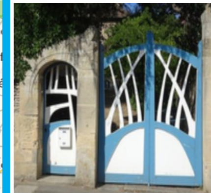
Maison la Blulette

L'édifice a été construit par l'architecte Hector Guimard en 1899 pour un avocat parisien, Prosper Grivellé. Le garage pourvu d'une chambre est ajouté vers 1925. La maison est, avec un autre édifice, « la seule maison rescapée de la première période de construction de Guimard ». L'édifice est classé et inscrit partiellement au titre des monuments historiques en décembre 2005.