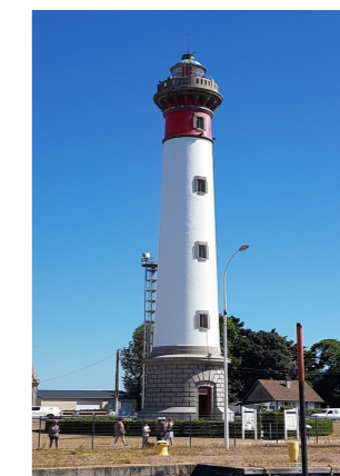
Phare de Ouistreham

Le phare de Ouistreham est un phare à terre, cylindrique, mesurant 38 m de haut, fabriqué en granite et peint en rouge et blanc. Il fut mis en service en 1905, mais un premier phare existait depuis 1886, c'était une tour carrée de 13 m de haut. Ce phare, à l'inspiration de Georges Simenon dans le roman « Port des Brumes ». C'est ainsi le phare Français le plus connu dans le monde.