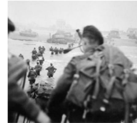
Sword Beach

Sword Beach est le nom donné à l'une des cinq plages du débarquement allié en Normandie le 6 juin 1944. Cette plage est attribuée à la Seconde armée britannique et c'est la seule plage où débarquent des commandos français. Cette plage s'étend sur 8 km de Ouistreham à Saint-Aubin-sur-Mer. C'est le point de débarquement le plus à l'est.