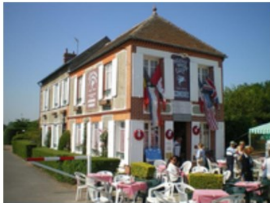
Café Gondrée

Le café Gondrée situé à 20m du Pegasus Bridge où se trouvait Thérèse et Georges Gondrée est considéré comme la première maison de France continentale à avoir été libérée. Le café est toujours en activité et les murs sont couverts de photos des chefs de l'opération, de vieux casques, insignes et de drapeaux.